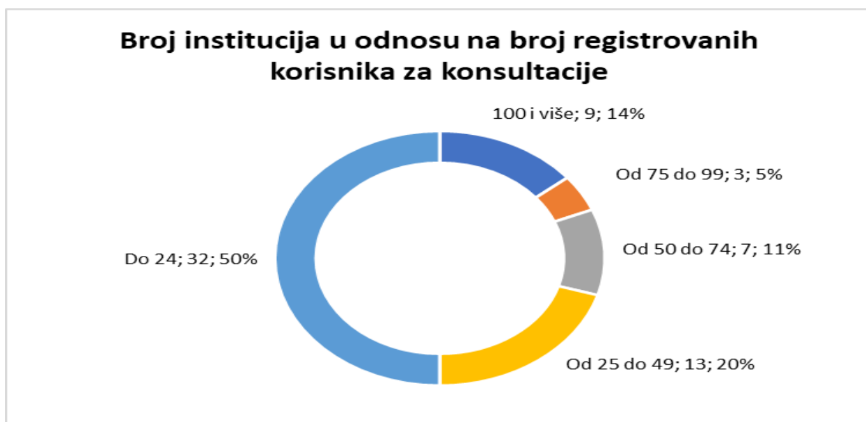
Grafikon 1: Broj zainteresiranih organizacija civilnog društva i pojedinaca za sudjelovanje u konsultacijama pri institucijama

Kod znatnog broja institucija koje koriste web platformu eKonsultacije pojavljuju se iste osobe i organizacije, a na popisima je vidljiv i određeni broj korisnika iz institucija Bosne i Hercegovine. Pojedine institucije Bosne i Hercegovine vode i vlastite popise zainteresiranih organizacija koje koriste prilikom organizovanja drugih vidova konsultacija (npr. dostavljanje nacrtu akata ili javne rasprave, stručni skupovi i sl.). Ukupan broj registrovanih korisnika web platforme eKonsultacije u decembru 2021. godine je 2972 i za 277 registrovanih korisnika je veći u odnosu na ukupan broj registrovanih korisnika web platforme eKonsultacije iz decembra 2020. godine.