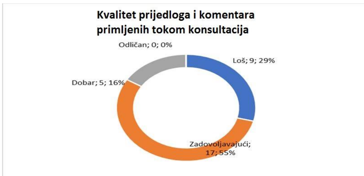
Grafikon 3. Ocjena kvalitete prijedloga i komentara javnosti

31 institucija se izjasnila i o postotku prihvaćenih prijedloga i komentara koje su dostavila pravna i fizička lica tokom konsultacija. Nijedna institucija nije navela da je prihvatila više od 80% prijedloga i komentara, 3 institucije su navele da su prihvatile od 50-80% prijedloga i komentara, 4 institucije su prihvatile 20-50% prijedloga i komentara, a 7 institucija su prihvatile manje od 20% prijedloga i komentara. Kada je riječ o stručnosti pravnih i fizičkih lica uključenih u konsultacije, institucije uglavnom smatraju kako je ona na zadovoljavajućem ili dobrom nivou.