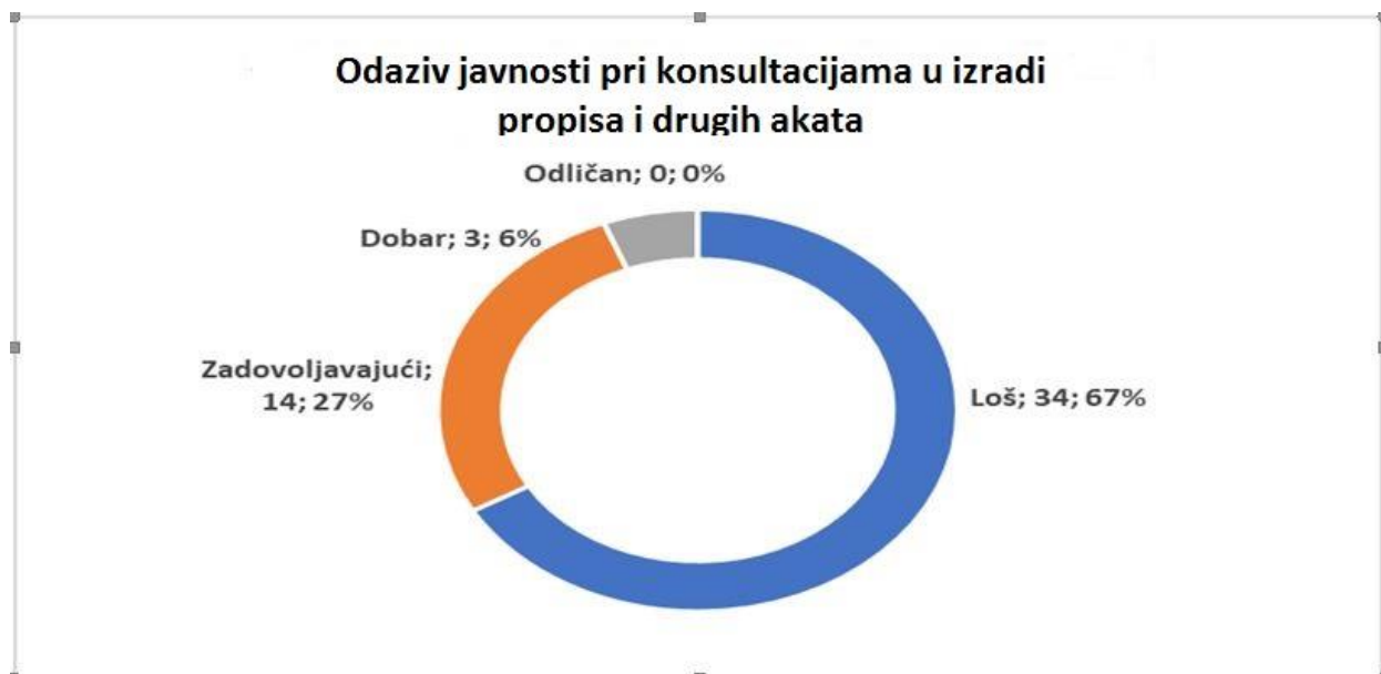
Grafikon 2: Ocjena odaziva javnosti u procesima konsultacija koju su dale anketirane institucije

20 institucija je navelo da nisu dobili nikakve prijedloge i komentare tokom konsultacija koje su provodile u 2020. godini. Od 31 institucije koje su dobile prijedloge i komentare, 5 institucija ih je ocijenilo dobrim, 17 zadovoljavajućim, a 9 lošim.