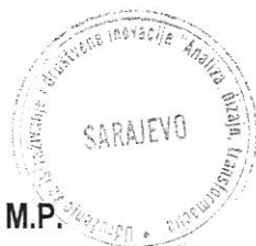
Elma Demir Odgovorno lice