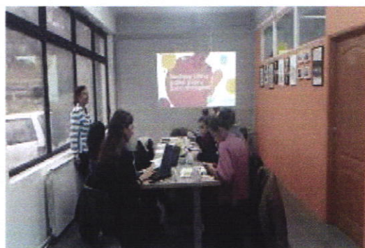
Trening „Monitoring kršenja ljudskih prava“, Tuzla, 28.11.2019.

U periodu od 21.11. – 16.12.2019. godine, ADI, zajedno sa Civil Rights Defenders (CRD), održala je 4 treninga na temu „Monitoring kršenja ljudskih prava“. Treninzi su održani u Sarajevu (21.11.2019.), Tuzli (28.11.2019.), Bijeljini (29.11.2019.) i Sarajevu (16.12.2019.). Treninzi su održani za organizacije civilnog društva koje se bave promocijom i zaštitom ljudskih prava radnika/ica, žena, nacionalnih manjina u BiH i LGBTI osoba. Cilj treninga je bio obučavanje lokalnih aktiviste/kinja kako uspješno sprovesti misiju monitoringa kršenja ljudskih prava u svojim lokalnim zajednicama a i šire, te kako pravilno podnijeti podnesak Instituciji ombudsmena bez da ista bude odbijena radi neispunjavanja osnovnih elemenata podneska.